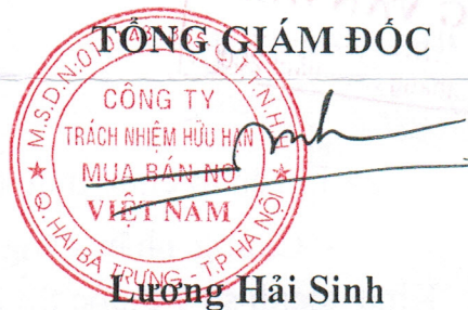
Lương Hải Sinh